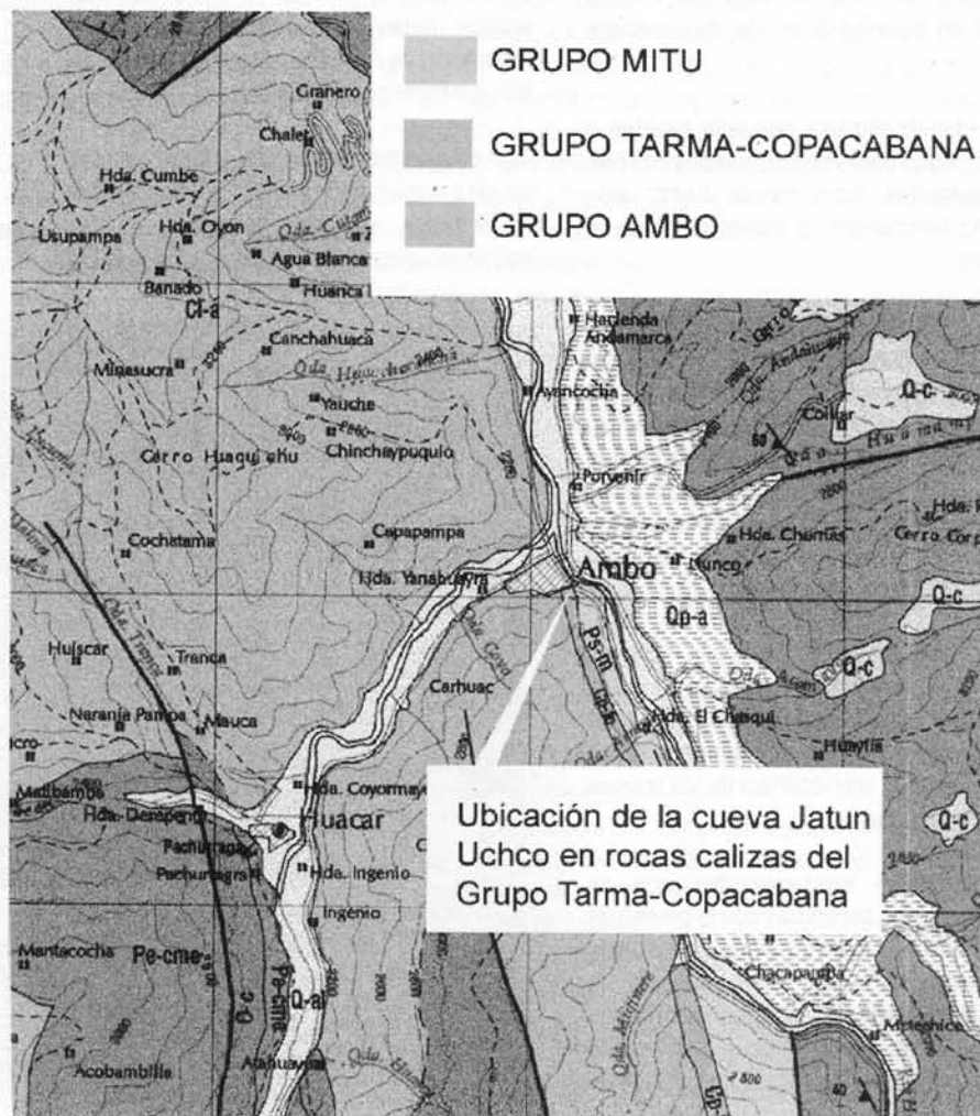
Figure 1 : Carte géologique de la région de Ambo (carte INGEMMET, 1/100 000) et localisation de la grotte de Jatun Uchco (extrait de Shockey et al., 2007).

Le réseau supérieur correspond à une grotte avec une entrée beaucoup plus grande. Elle se développe sur une centaine de mètres, est sommairement aménagée et fréquemment visitée par les touristes. On y accède par un chemin bien tracé depuis le centre du village. Elle contient quelques restes archéologiques (Ravines, 1993).