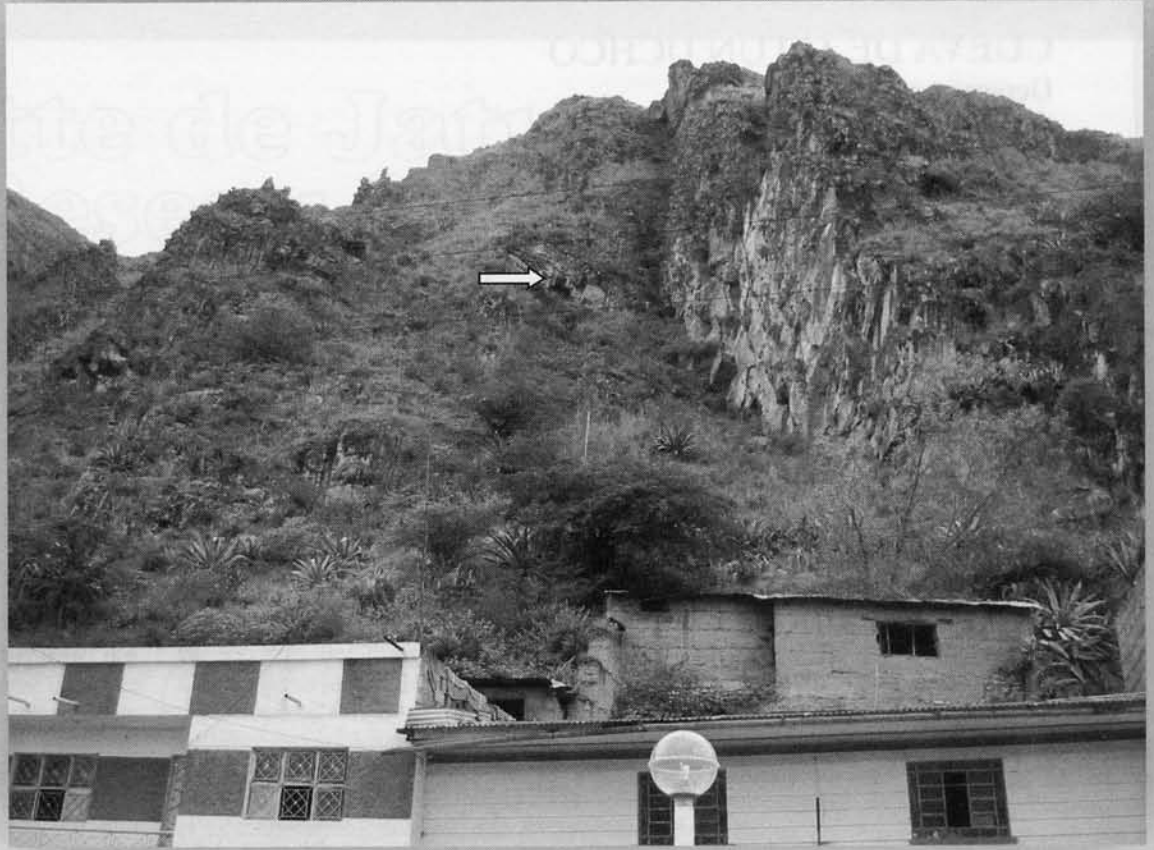
Photo 1 : Localisation et accès de la grotte du réseau inférieur de Jatun Uchco dans la ville d'Ambo (Département de Huánuco, Pérou).

En coupe, la topographie montre que les restes fossiles se situent dans la partie profonde de la cavité et qu'ils s'échelonnent à partir du P14 (Photo 2), ce qui laisse supposer une seconde entrée située au dessus de ce puits par laquelle ont chuté et ont été piégés les mammifères du Pléistocène.