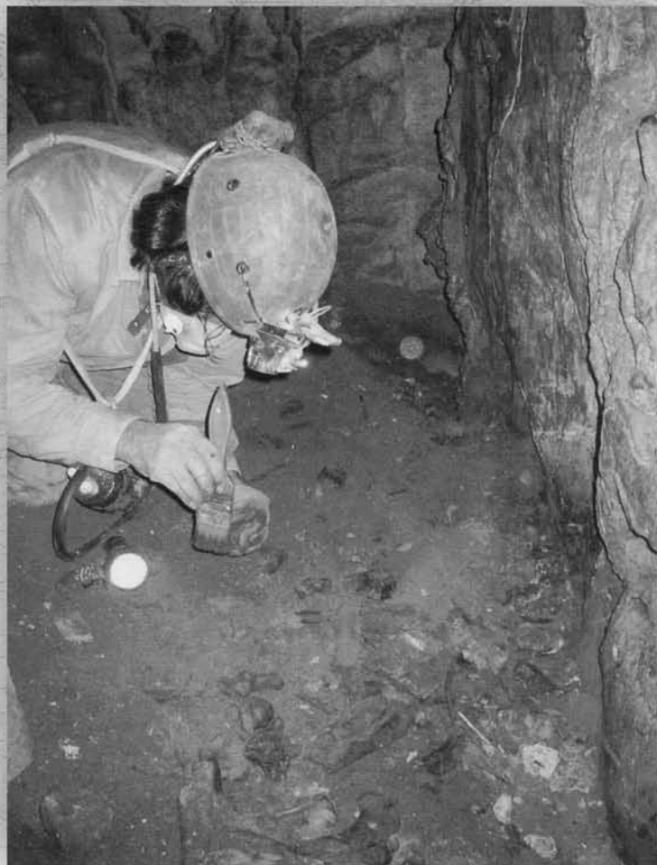
Photo 2 : Restes de fossiles de mammifères du Pléistocène Tardif au pied du P14.