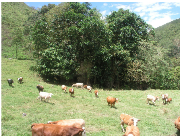
L'entrée de la cueva de los Vampiros (JYB, 23/08/2016)

La grotte est une simple galerie qui boucle entre deux porches contigus. Elle sert d'abri à de nombreux vampires. Terminé.