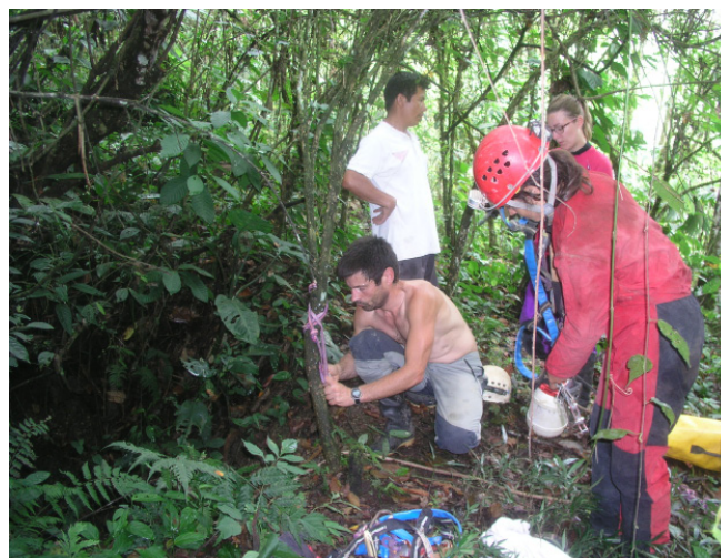
Entrée de la cueva Seca de Naciente del Rio Negro (JYB, 03/09/2016)

Continuer l'exploration demande à forcer les étroitures (désobstruction), et tenter quelques escalades. Mais attention, la présence de CO2 donnera un bon mal de tête à celui qui poursuivra les explorations. L'intérêt est limité.