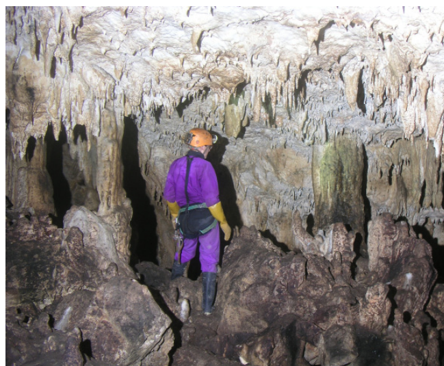
Salle principale de la cueva Seca de Naciente del Rio Negro (JYB, 03/09/2016)