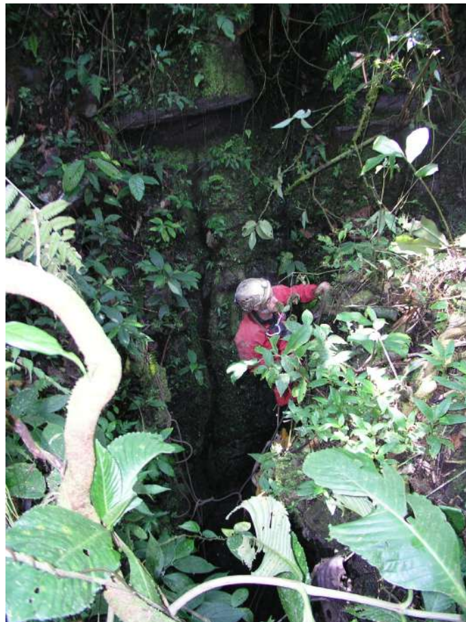
L'entrée du tragadero del Carnicero. (JYB, 24/08/2017)