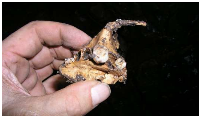
Ossement trouvé dans le tragadero del Carnicero. (JYB, 24/08/2017)