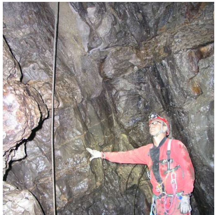
Le tragadero del Carnicero. (JYB, 24/08/2017)

(c) licence CCby-nc : http://creativecommons.org/licenses/by-nc/3.0/ 2017