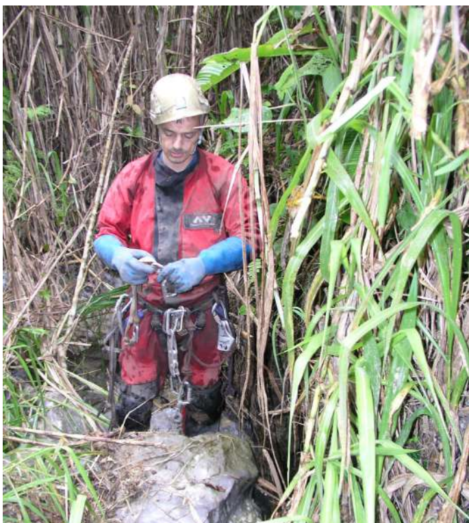
A l'entrée du tragadero del Puguito. (JYB, 24/08/2017)

La cavité est une perte de 1 m de diamètre qui s'ouvre dans le lit d'un ruisseau temporaire. En crue, le ruisseau continue après la perte, indiquant probablement une mise en charge