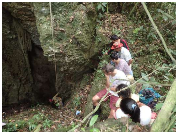
Entrée de la cueva Chica. (BL, 28/08/2017)

Grotte ébouleuse sans intérêt. Pas de perspectives.