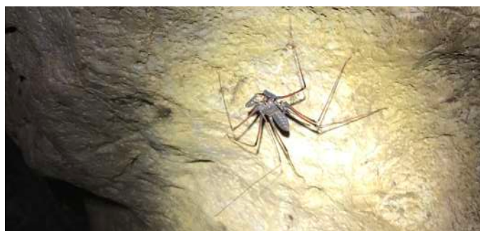
Amblypige dans la cueva de la mano negra de Chaurayacu. (SA, 18/08/2017)