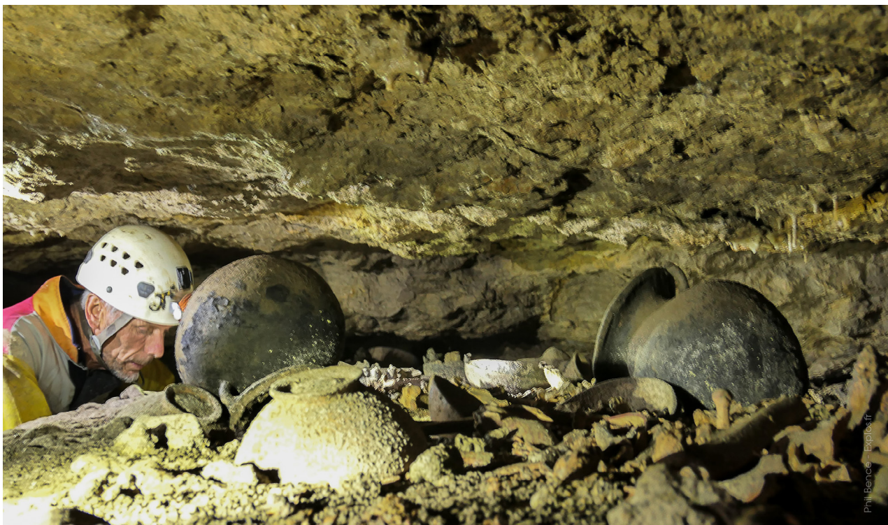
Vestige archéologique dans une grotte près de Luya (PB, 17/11/2017)