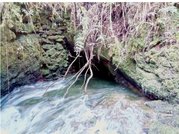
Résurgence du Rio Olia inférieure (XR, 21/11/2017)

Le débit de cette résurgence est caractéristique d'un système karstique important. Mais la localisation de cette résurgence dans des blocs donne peu d'espoir d'exploration par ce côté. Peut être qu'une fouille des barres rocheuses au dessus permettrait de trouver un passage, mais notre guide nous a affirmé qu'il ne connaissait pas d'autres grottes dans le coin.