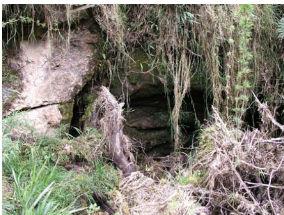
L'entrée du tragadero X5. (JYB, 18/08/2018)

(c) licence CCby-nc-sa : http://creativecommons.org/licenses/by-nc-sa/3.0/ 2018