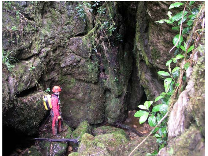
Tragadero de Ancayrrumo. (JYB, 17/08/2018)