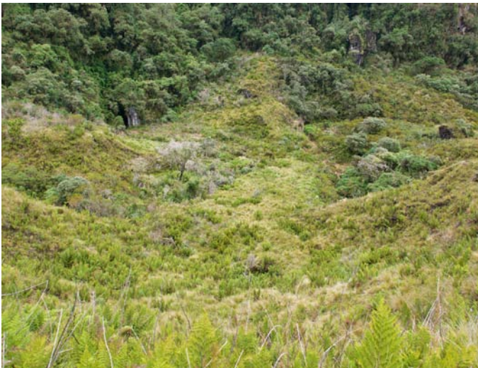
Tragadero de Ancayrrumo. (XR, 17/08/2018)