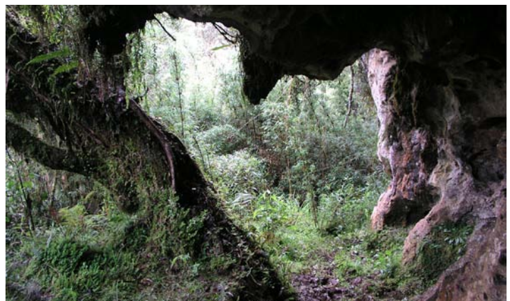
Cueva del Refugio. (JYB, 17/08/2018)

Exploración: Carlos Amasifuen, Jean-Yves Bigot, Jean Loup Guyot, Jhensen Quispe 2018 Topografiado por: Carlos Amasifuen, Jean-Yves Bigot, Jean Loup Guyot, Jhensen Quispe 2018 Dibujo: Jean-Yves Bigot 2018 Club(es): Espeleo Club Andino (ECA), Groupe Spéléologique de Bagnols Marcoule (GSBM) Expedición: Nor Perú 2018 Compilación: Therion 5.4.2+? (compiled on 2019-01-08) e/ 03.02.2019 (c) licence CCby-nc-sa : http://creativecommons.org/licenses/by-nc-sa/3.0/ 2018