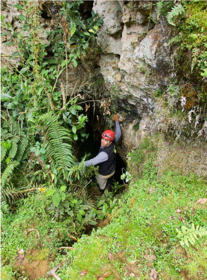
Tragadero del Hacha. (XR, 19/08/2018)