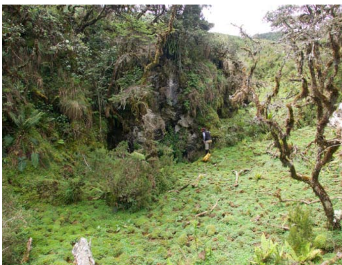
Tragadero del Hacha. (XR, 19/08/2018)

C'est une simple galerie descendante qui est rapidement colmaté. Une hache taillée dans du schiste a été trouvée au fond. Du courant d'air filtre à travers les blocs.