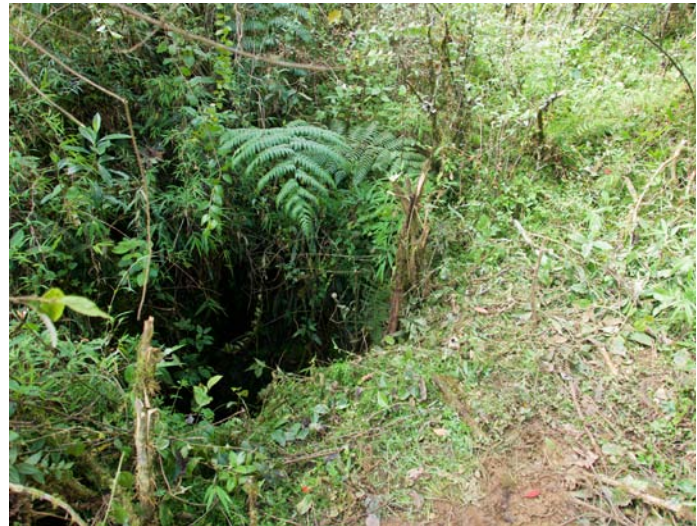
L'entrée du Tragadero del Oso. (XR, 17/08/2018)

Lat : -6.324746 Long : -77.761963 Alt = 3016 m