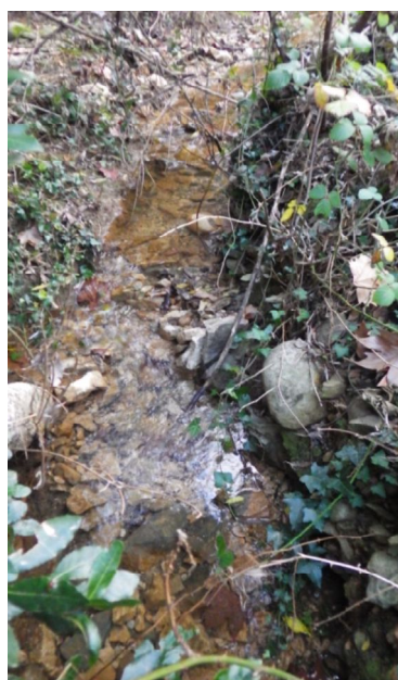
L'eau affleure et forme un ruisseau

Le point exact de sortie des eaux n'est pas net