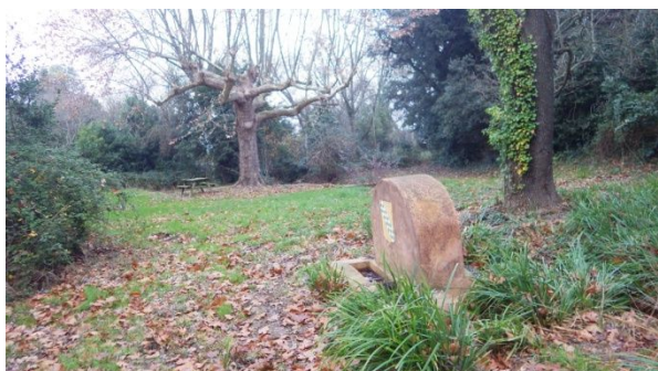
Le site de la source

Le point exact de sortie des eaux n'est pas net