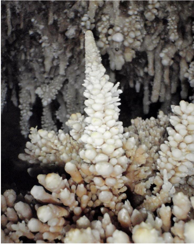
Petit sapin d'excroissances bulbeuses.