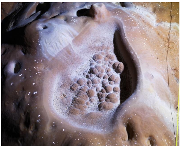
Au sol, une sorte de bassine calcifiée remplie de perles recouverte et figées par et dans la calcite (DB)