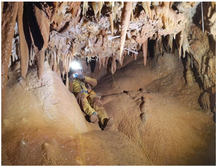
Plafond de pics acérés, observez la couleur ocre derrière.(DB) Allongé sur la coulée je capture des images.