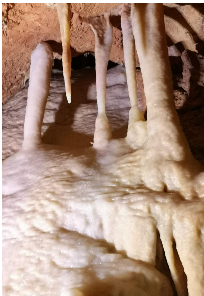
(DB) Petit piliers et coulée de calcite laiteuse.