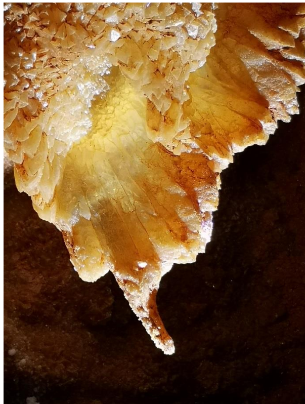
Excentriques exubérantes vu par Daniel -----> Avec 1 conglomérat de cristaux de calcite (DB)