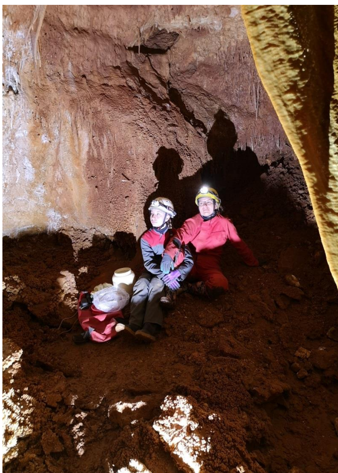
Enfin on peut se poser.