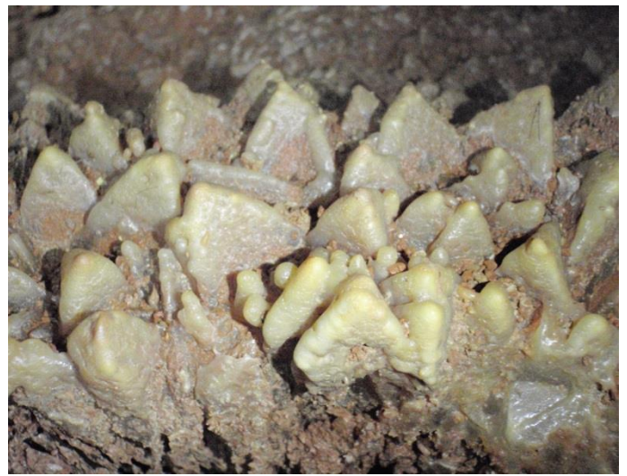
Triangles calcifiés surgissant sur le plancher.