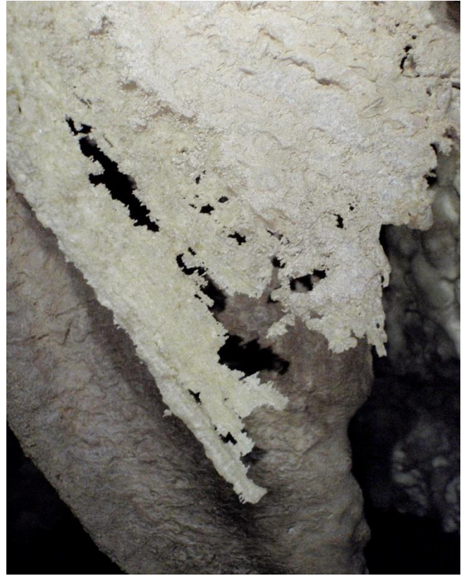
Erosion de la roche.