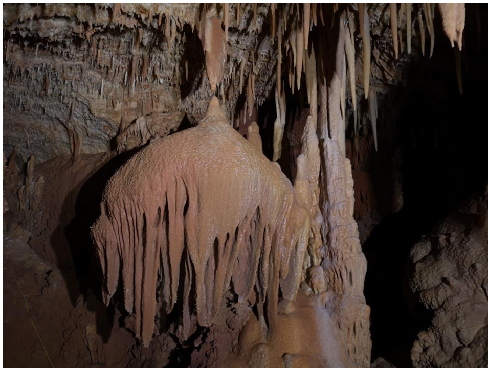
La méduse calcifiée qui plane dans les airs.(DB)