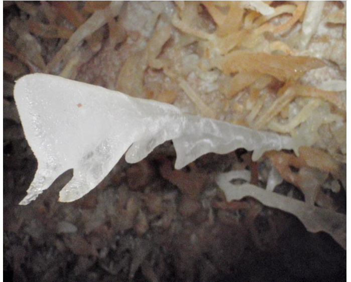
Concrétions excentriques exubérantes.(JS)