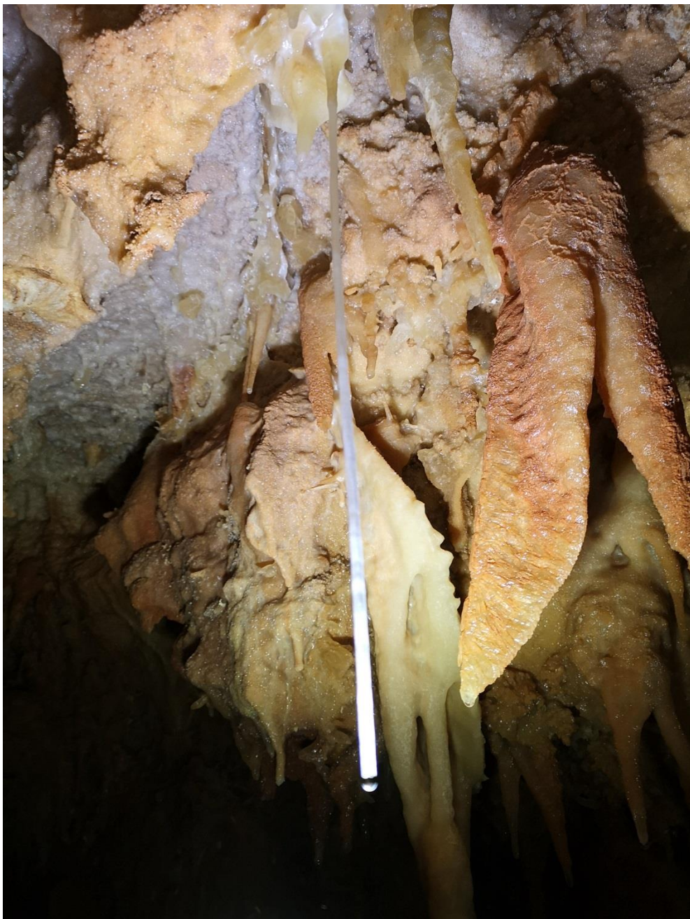
Frêle fistuleuse rectiligne jouxtant 1 sabre imposant.(DB)