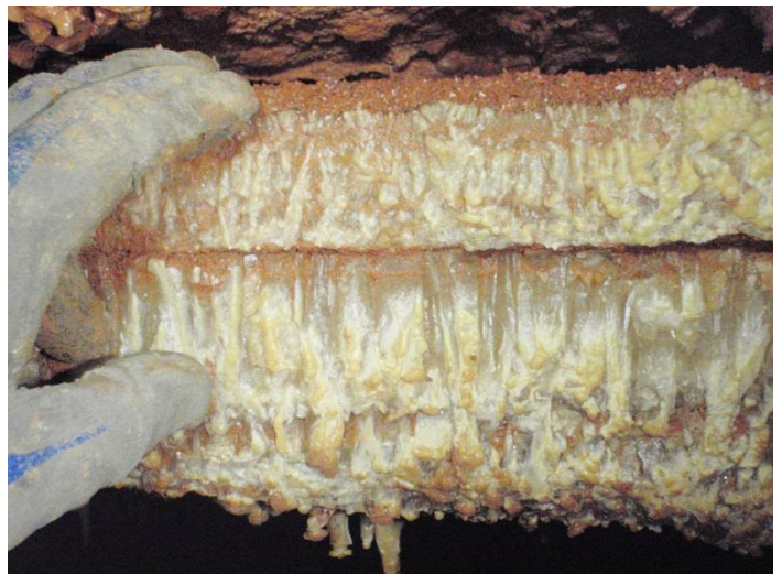
Plancher de calcite sectionné.(JS)