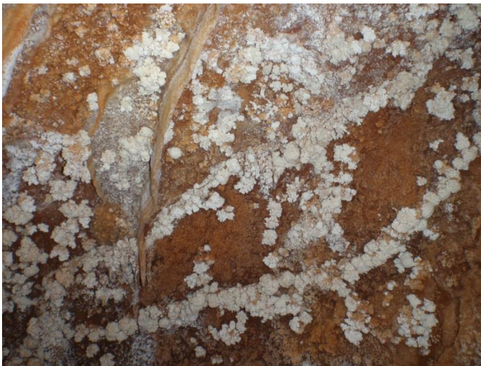
Pop-corn sur la paroi.