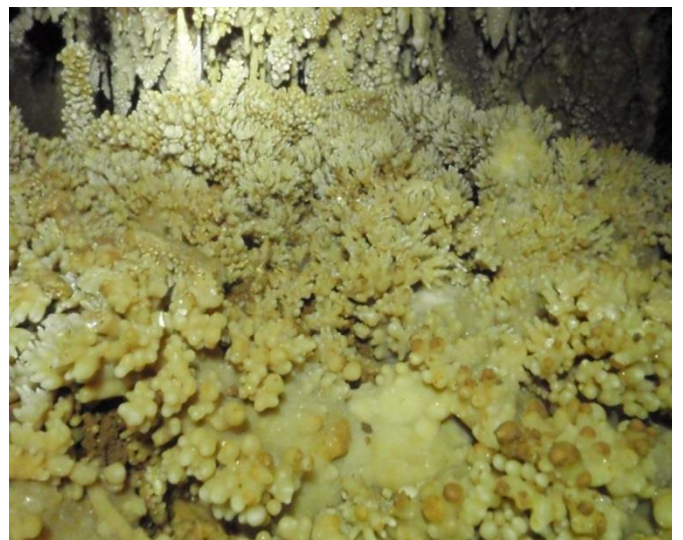
Excroissances bulbeuses (JS)