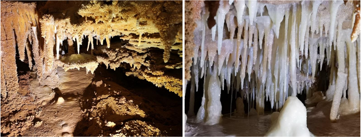
La calcite fait ce qu'elle veut, ici, elle s'amuse à tout fermer, et là à tout mettre en blanc.(DB)