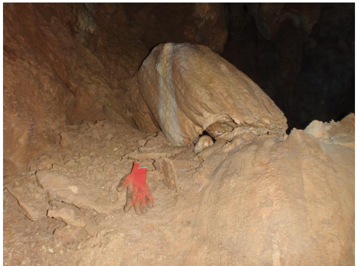
(JS) Enorme morceau de massif stalagmitique posé là.