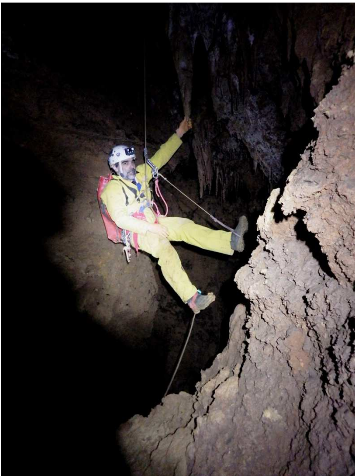
... Montée vers le méandre de plafond ...,