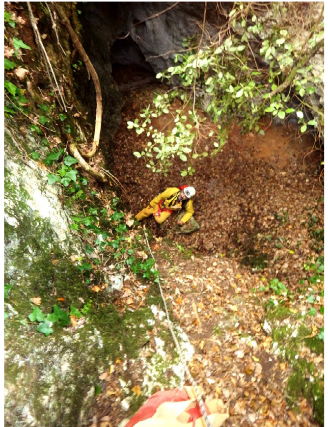
... au bas du puits d'entrée ...,