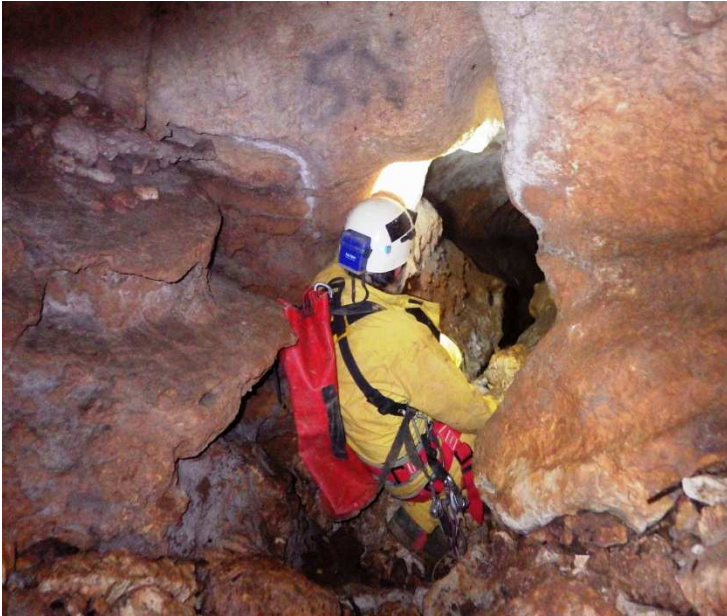
... au départ du méandre d'entrée ... ,