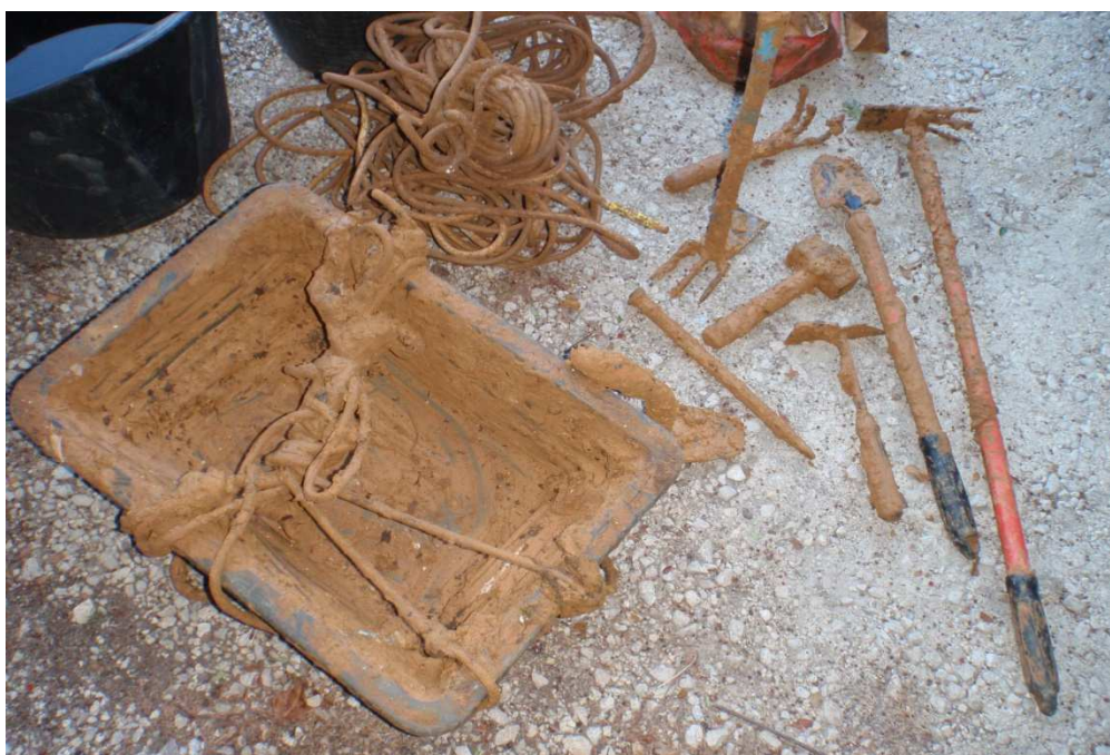
Etat du matériel sorti (JS)

Etant habité par une envie de clore ce labeur devenant interminable, je décidais d'aller sortir le matériel de désobstruction, les cordes et amarrages personnels, et laisser une corde/amarrages GSBM à la remontée de 10m qui mène au boyau en cours de désencombrement(au cas où l'envie nous reprendrait de reprendre ce travail,... ou d'autres).