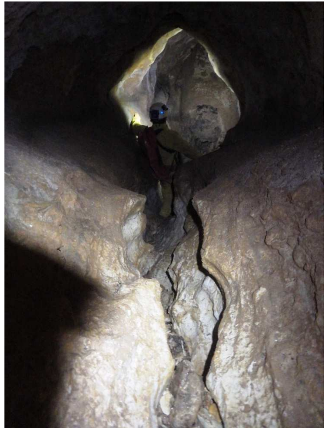
... dans le méandre d'entrée ...,