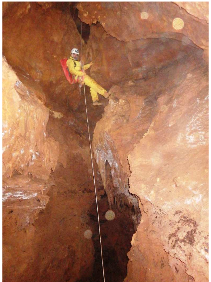
... Descente vers la sortie.