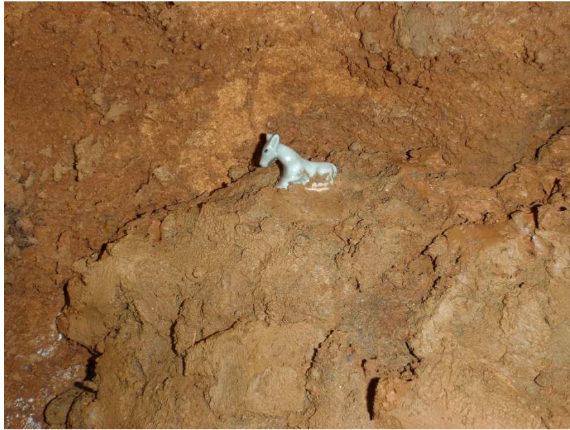
La petit âne de l'Aven de l'Âne