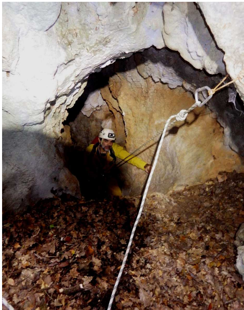
... dans le ressaut de 6m d'entrée...,