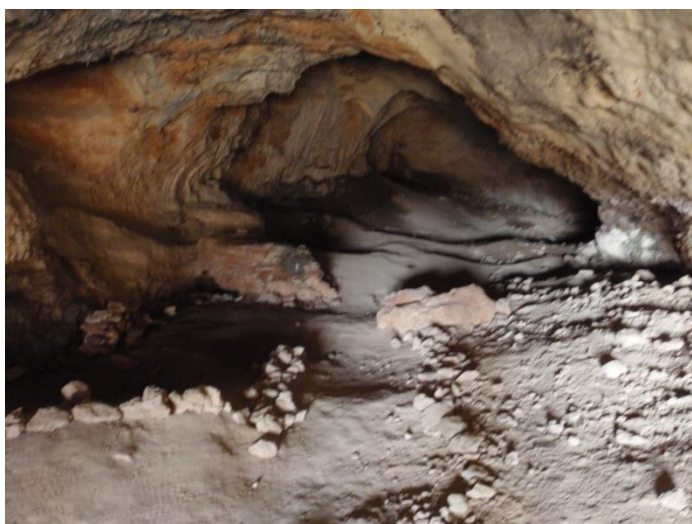
La galerie depuis l'entrée...