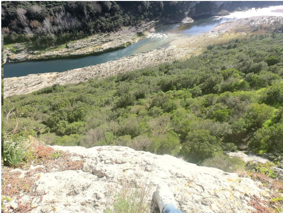
Vue depuis l'extrémité du seuil de la Grotte(HG)

Nul doute, cette cavité a dû servir d'abri à toutes les époques. Sa situation éloignée et en hauteur en fait 1 repère de choix. Sa vastitude accueillante a sûrement permis à 1 grand nombre d'humains d'avoir une habitation rassurante. Les infiltrations d'eau sont nombreuses et suffisantes pour la consommation courante. Sa promiscuité d'avec le Gardon(15mn~) est 1 autre facteur de choix, avec bien sûr la possibilité de récolter du bois pour se chauffer, et de la nourriture végétale.