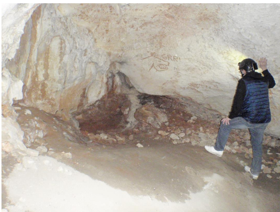
Le fond et son remplissage. Et le graffiti d'ours qui grogne(JS)