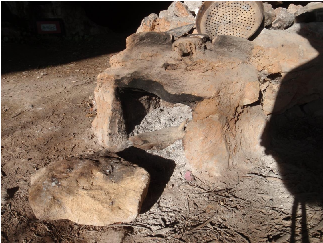
Le petit four annexe bâti en pierre et en argile(JS)