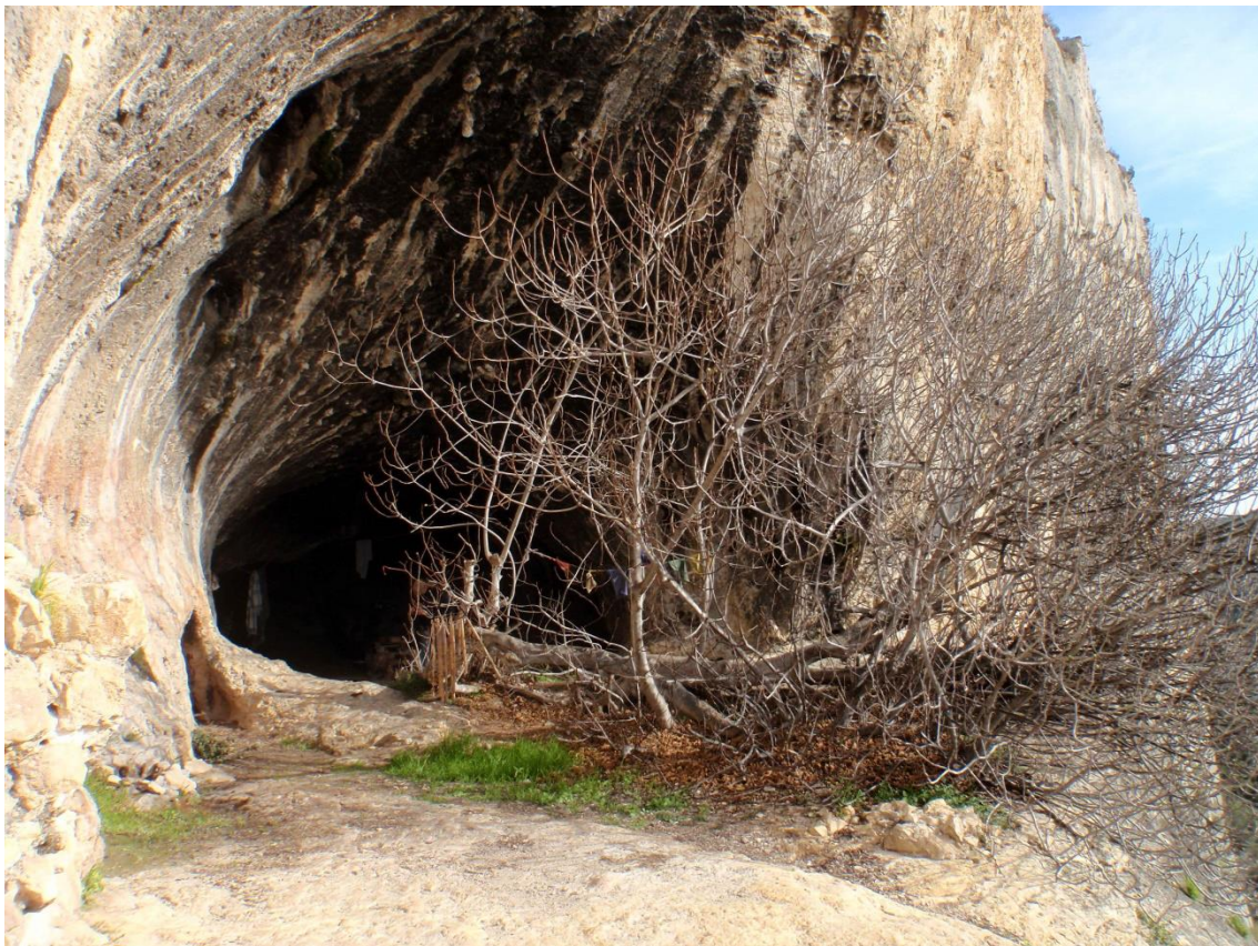
Porche d'entrée de la Grotte avec le figuier couché(JS)