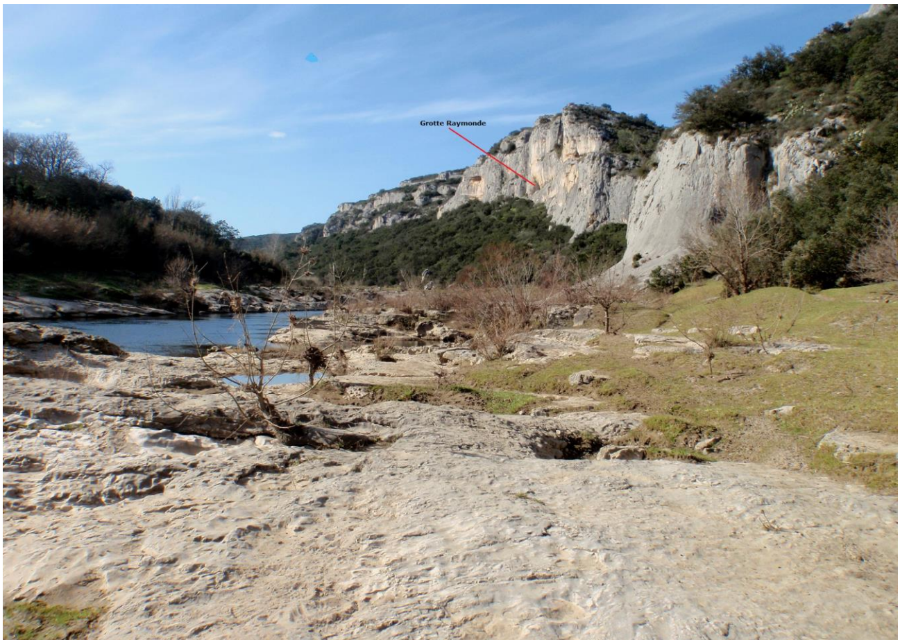
Situation de la Grotte/Baume Raymonde depuis le bord du Gardon(JS)

Il y a aussi des restants d'un ancien mur construit probablement pour éviter que le vent ou la pluie entrent dans l'abri. Ou encore pour éviter les invasions intempestives ?