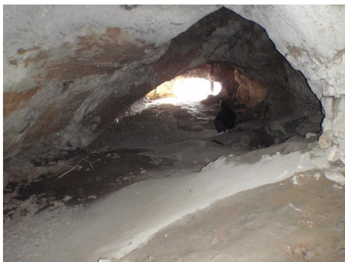
... et depuis le fond(JS)