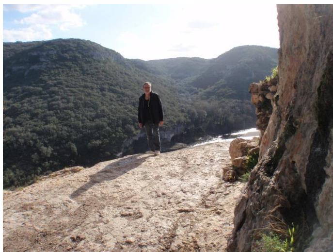
Depuis sous le porche, le seuil avec ce qui reste du mur à droite(JS)