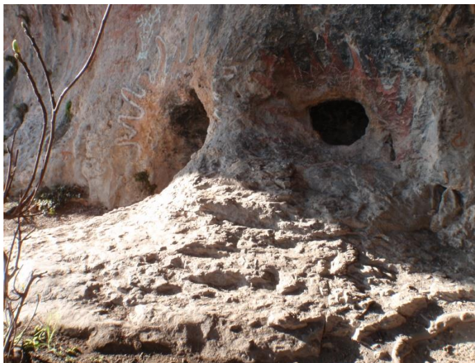
Trous dans la paroi. Anciens fourneaux ?