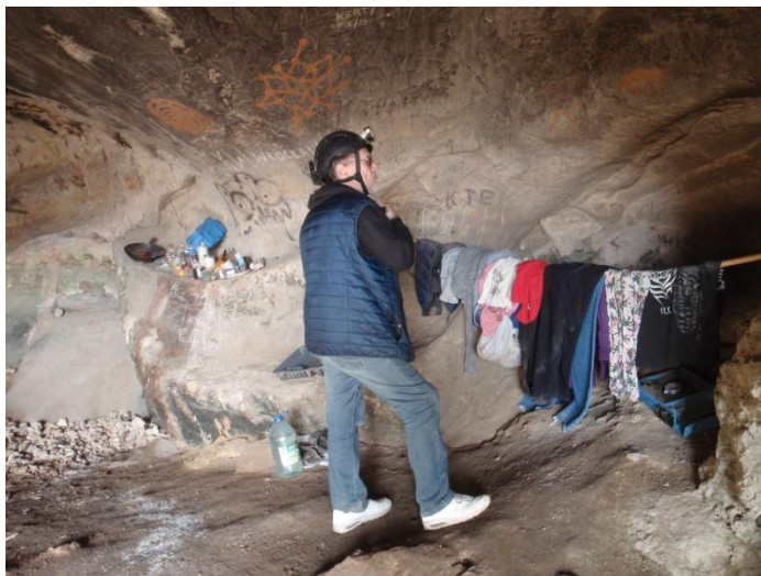
Etendages de vêtements et étagère en rebord de roche en paroi(JS)