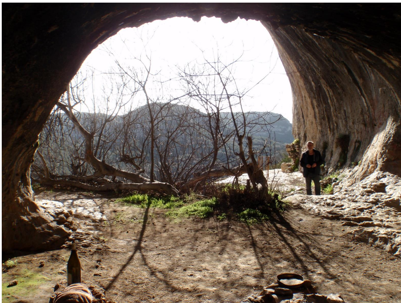
Vue générale depuis le début de la galerie, ce qui reste du mur est bien visible à droite. Ce mur allait jusqu'au bord du vide à gauche(JS)