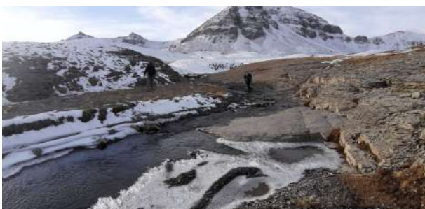
Le passage du ruisseau du Carton (CF)

Nous rangeons la cabane, cela risque fort d'être la dernière journée de la saison.