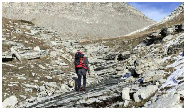
Alain en tête (GD)