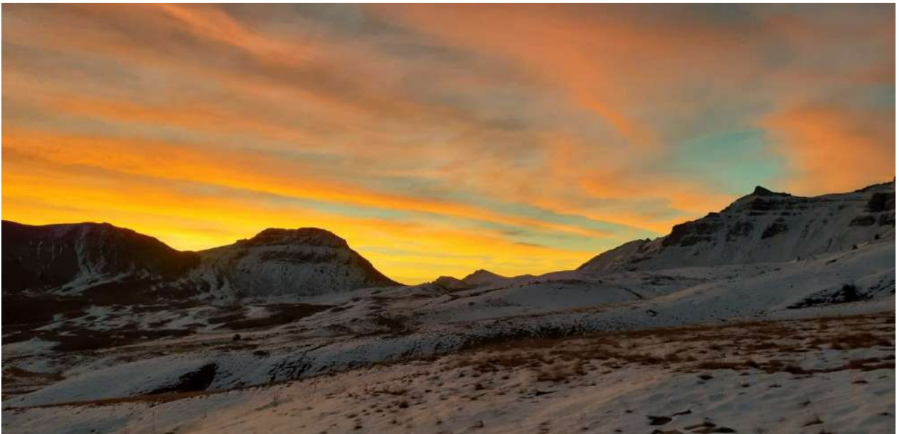
Lever de soleil (CF)

Nous rangeons la cabane, cela risque fort d'être la dernière journée de la saison.