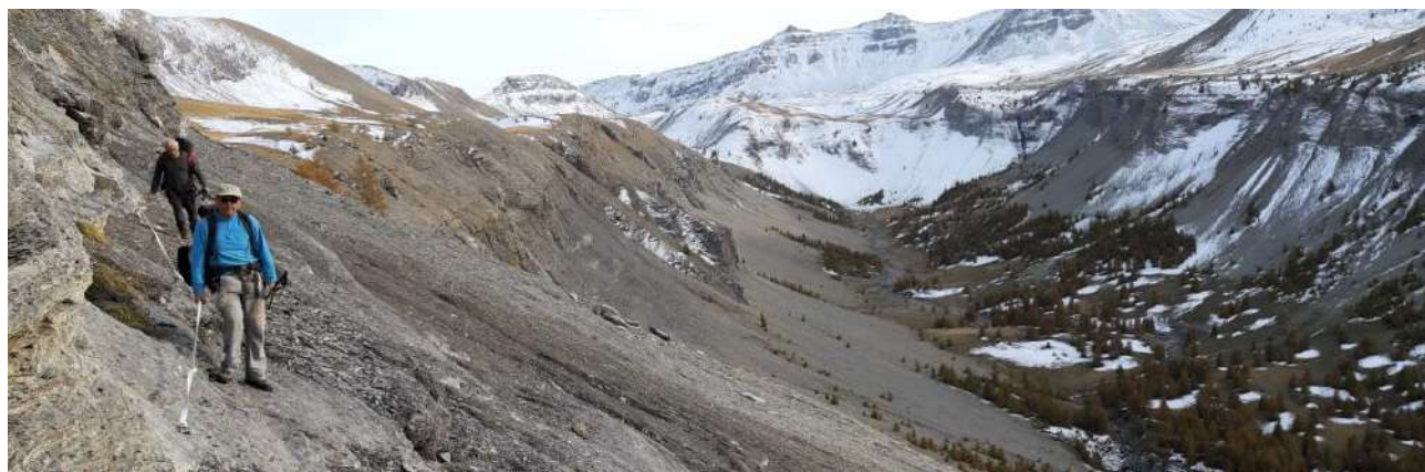
Alain et Guy suivent la main courante (CF)

Nous passons par quelques dolines qui mériteraient d'être vues plus en détail. Quelques chamois se montrent sur les crêtes. La neige se fait de plus en plus rare ce qui facilite notre avancée. Nous arrivons au cabanes du Clôt de l'Aï vers 17h. La petite cabane est ouverte, elle ne peut pas accueillir plus de deux personnes ! Le soleil commence à baisser et nous cherchons la suite du trajet. À partir des cabanes, une série de cairns nous guide, puis nous cherchons un peu à flanc avant de trouver une main courante.