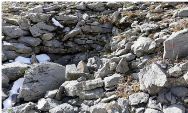
Repérage du n°24 (GD)

Nous partons vers 15h et décidons de redescendre en passant par le Clôt de l'Aï. Au passage nous pointons des entrées potentielles : 23, 24 , 28, 25 et 26. Le trajet est sensiblement horizontal et reste au-dessus de la barre nummulitique.