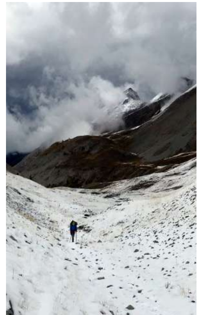
Lourdement chargés ... (PA)

Nous allons voir le lac puis la cabane du Lignin.