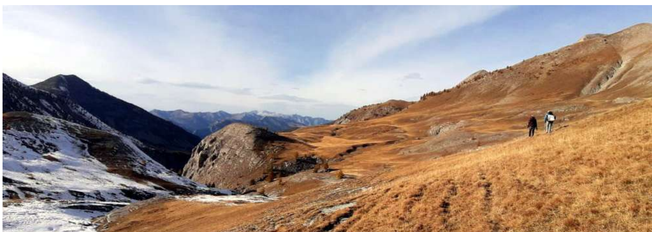
Le Clôt de l'Aï (CF)

Nous passons par quelques dolines qui mériteraient d'être vues plus en détail. Quelques chamois se montrent sur les crêtes. La neige se fait de plus en plus rare ce qui facilite notre avancée. Nous arrivons au cabanes du Clôt de l'Aï vers 17h. La petite cabane est ouverte, elle ne peut pas accueillir plus de deux personnes ! Le soleil commence à baisser et nous cherchons la suite du trajet. À partir des cabanes, une série de cairns nous guide, puis nous cherchons un peu à flanc avant de trouver une main courante.