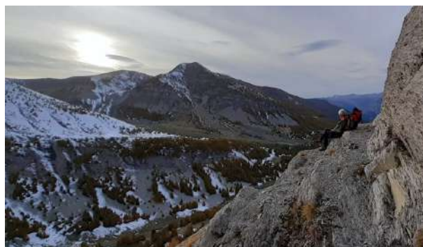
Au-dessus de Bressange (GD)

Le sentier est maintenant plus aisé, nous sommes au-dessus de Bressange. Nous ne descendons pas vers les cabanes, mais coupons à travers bois pour rejoindre la voiture de Guy. Nous chargeons rapidement les affaires et nous redescendons sans problème jusqu'à la voiture d'Alain.