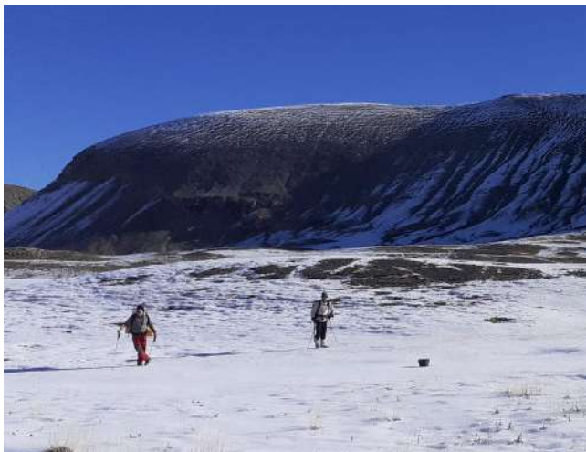
Le seau voyageur (GD)

Sur le trajet vers le gouffre, nous rencontrons un de nos seaux oublié par la crue.