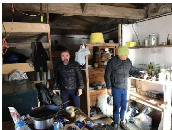
Préparatifs au Carton (PA)

Au gouffre, nous commençons les problèmes : une batterie d'interphone est HS. Nous nous en sortons en bidouillant un accu de lampe.