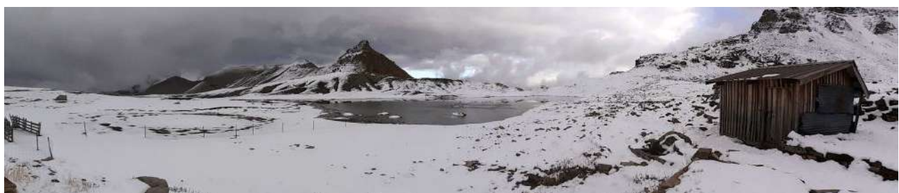
Le lac et la cabane de Lignin (GD)

Nous allons voir le lac puis la cabane du Lignin.