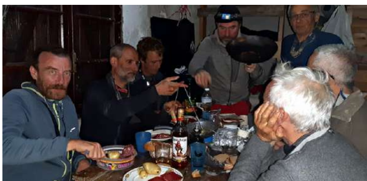
La raclette