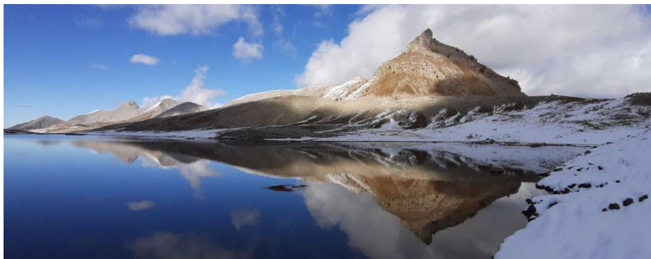
Le lac (CF)

Alain rejoint l'équipe du fond et à trois ils commencent à évacuer les débris de la rotonde vers le puits.