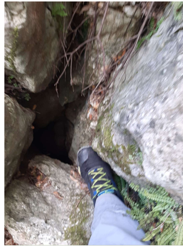
La fissure vue « d'ensemble » et le recoin dégagé