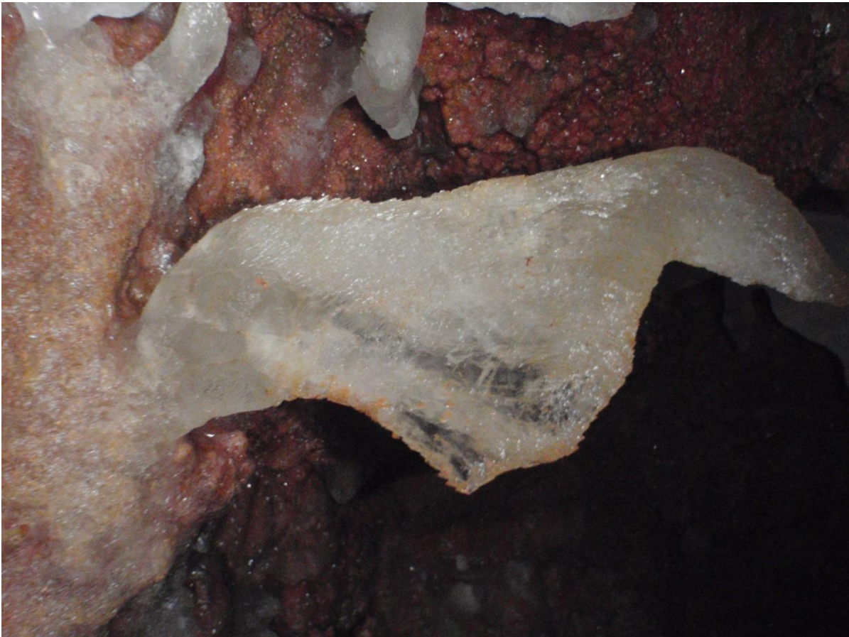
Autre forme excentrique mastoque.(JS)