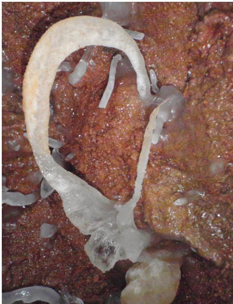
Sortie, de je ne sais qu'elle magie de la roche, cette formation extravagante serait-elle « l'Oreille » de l'Aven du Point G ?? (JS)