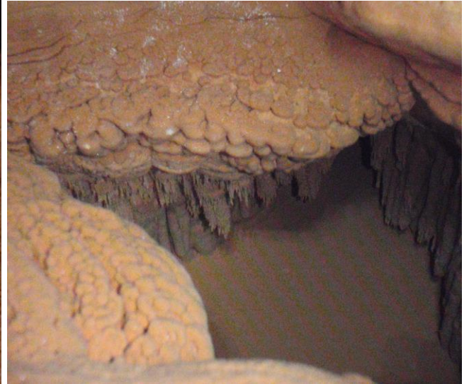
Parterre de Gours sur coulée calcifiée - - - - - > Détail du premier Gour avec ses concrétions aquatiques et son eau transparente.(JS)