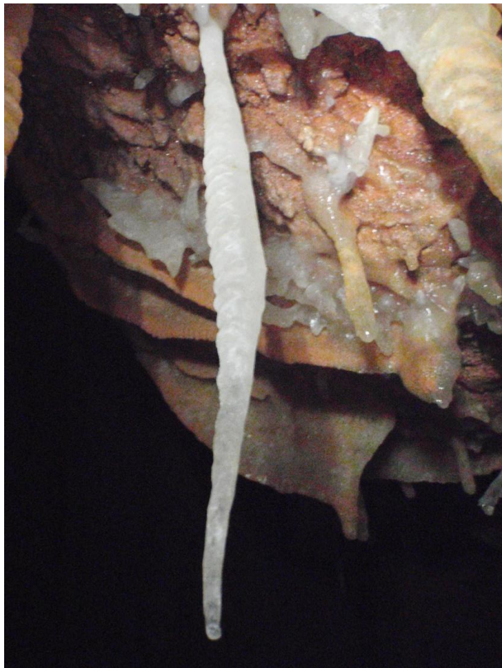
Plus éfilée mais peu commune, cette stalactite blanche à canelures.(JS)