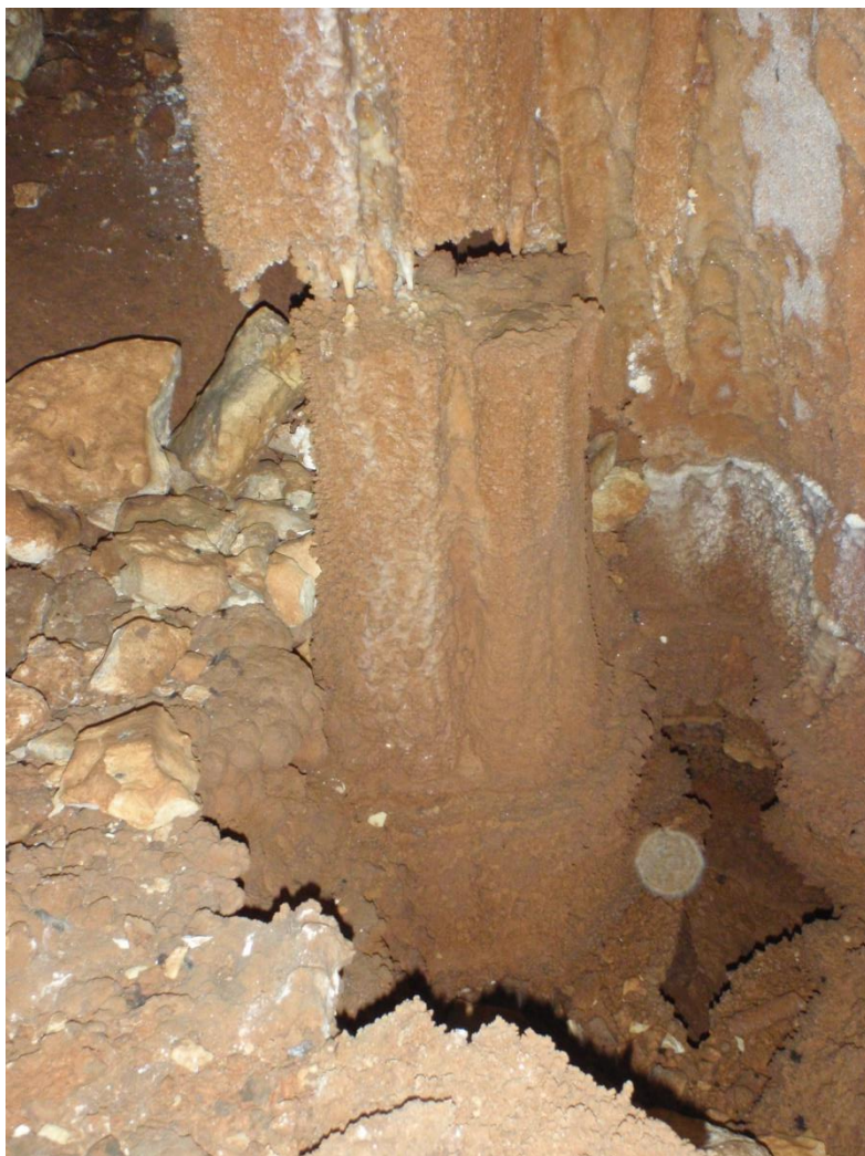
Autre résultat de ce soutirage puissant.(JS)