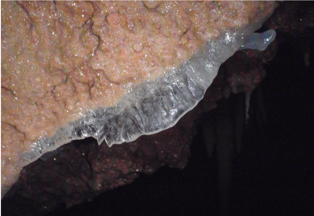
Quasiment transparente, cette excroissance de la roche infiltrée par l'eau pure, pourrait devenir un beau miroir ...(JS)