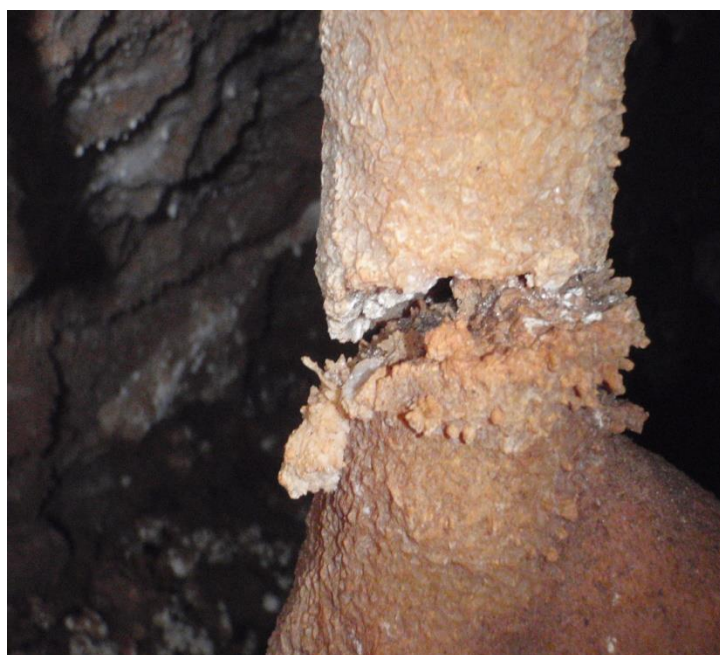
Effet d'un soutirage qu'il y a eu au bas du puit d'entrée. La colonnette a été sectionnée en bas et en haut et elle s'est resoudée en se décalant de sa partie haute. (A gauche la vue d'ensemble, à droite la partie basse) (JS)