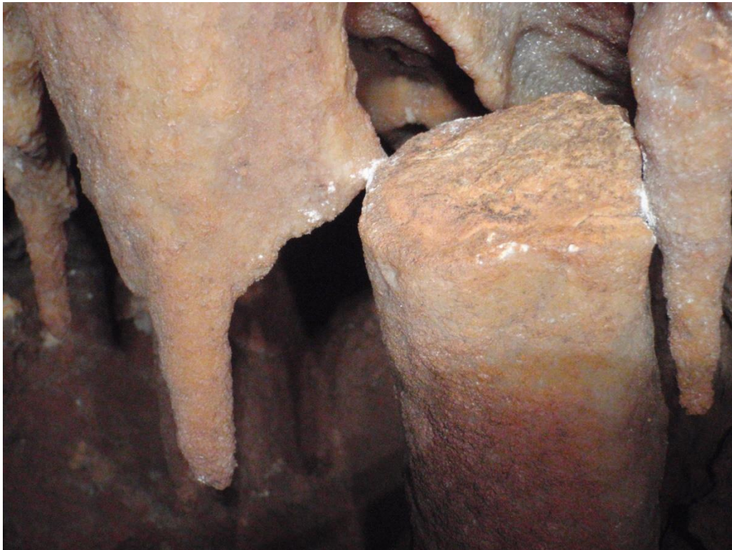
Partie du haut qui a ripé et s'est coincée contre une stalactite.(JS)