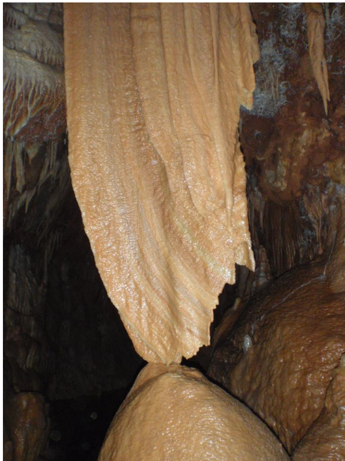
Drap calcifié au milieu de la galerie du Gour Suspendu.(JS)