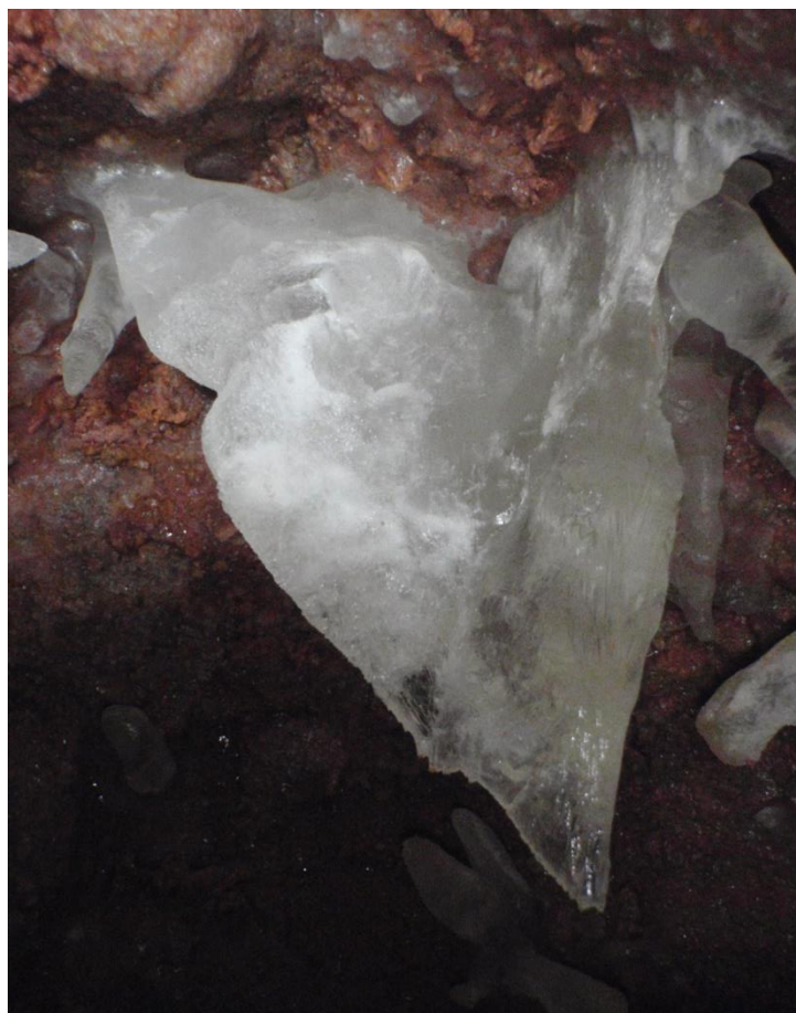
Forme curieuse qui sort de la paroi vers le bas du puit d'entrée.(JS)