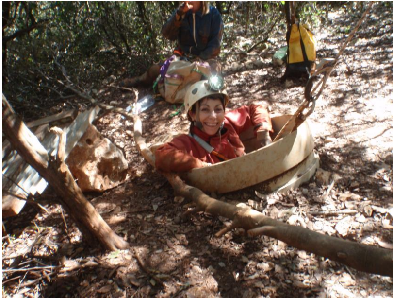
Romelia enchantée de l'exploration.(JS)