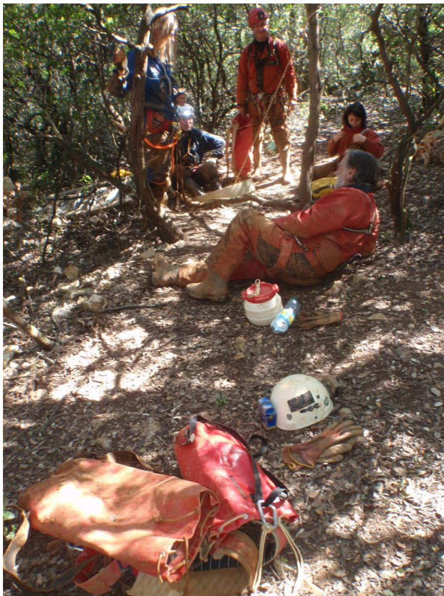
Toute l'équipée est dehors par 1 temps radieux et chaud ~30°.(JS)