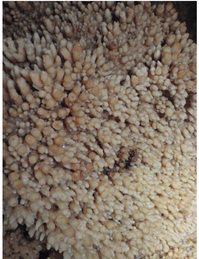
Parterre de micro-gours avec des massifs en chou-fleur(JS)