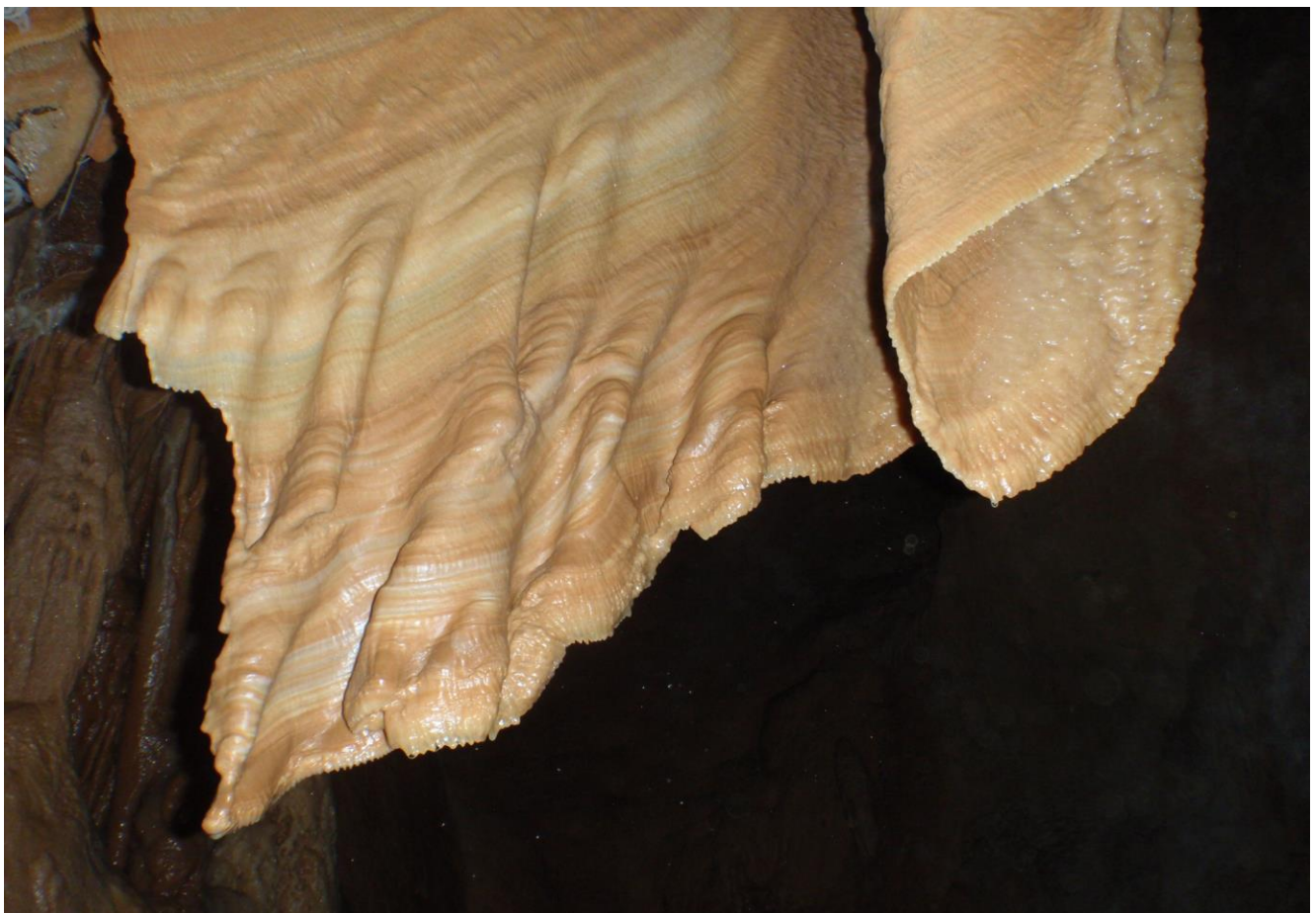
Tenture calcifiée et chiffonnée dans le Réseau du Gour Suspendu. L'ambiance a dû être bien tourmentée en ces lieux pendant des milliers d'années ??... (JS)