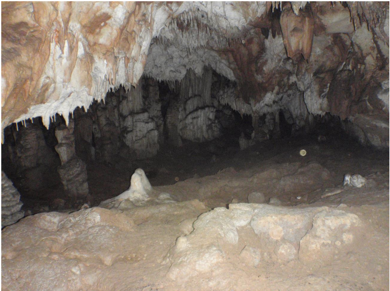
Vue de la Salle depuis la photo du haut.

Une Salle se déploie et je peux me mettre debout (3 à 4m de haut et une 20ème de m. de diam. J'en fais le tour pendant 1 petite heure en observant scrupuleusement de partout. Beaucoup de morceaux noirs (charbons de bois ?), de concrétions anciennement cassées, d'arrangements probables de certains coins, peut-être présence de bauges à Ours(?) ou de Blaireaux car petites(?) - (Petites griffures à différents endroits sur le bas de la paroi). 3 ou 4 Chauves-souris pendues. Quelques os, des plumes noires sur le sol récentes, un morceau de mâchoire de petite bestiole (loir?) toute fraîche avec de petites dents pointues. Je trouve 1 morceau de poterie(!).