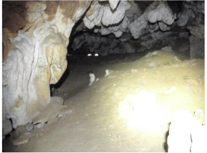
Vue de l'entrée depuis la zone terreuse