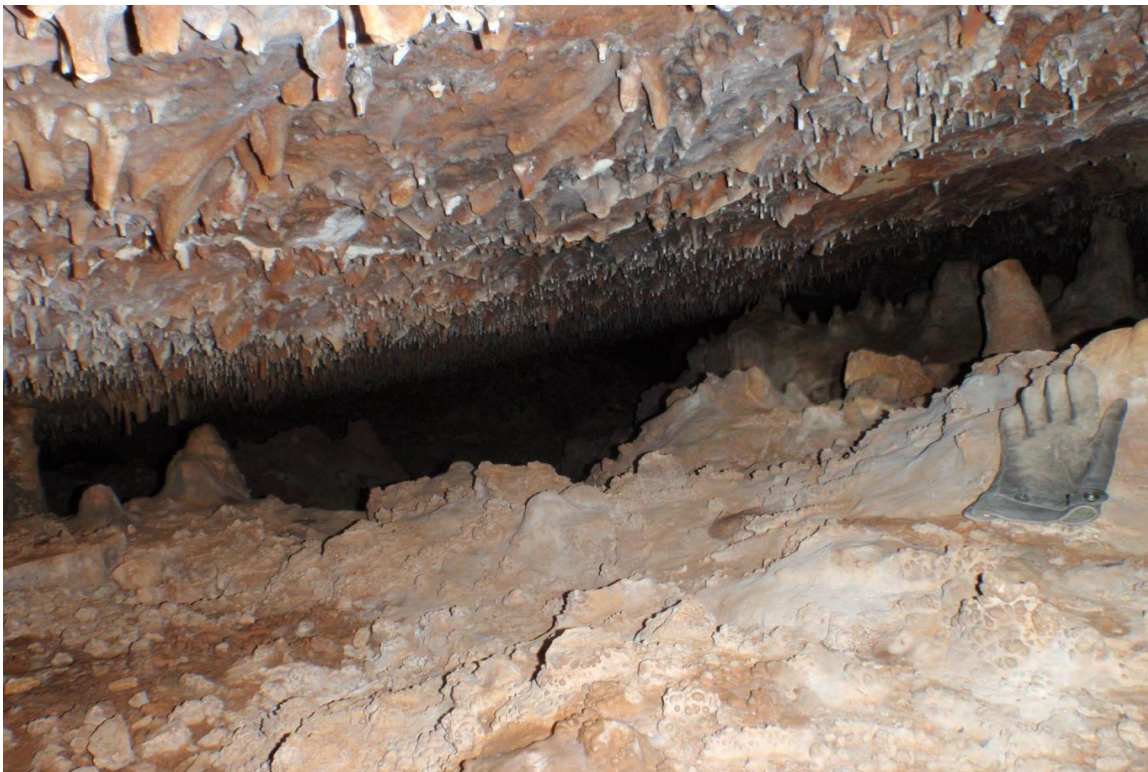
La salle surbaissée qui se prolonge sur une 20ème de mètres, ~50cm de hauteur au départ.

L'entrée est assez large pour que je me laisse glisser dedans(elle se prolonge sur la droite mais elle est entrecoupée de blocs). J'allume ma frontale, une salle large et surbaissée se montre à la lumière. Le plafond est totalement hérissé de courtes concrétions, pour la plupart cassées. Le sol est chaotique avec un fouillis de blocs, des stalagmites cassées et un joli petit gour au milieu de cet espace sans Co2. Je sens un bon courant d'air aspirant.