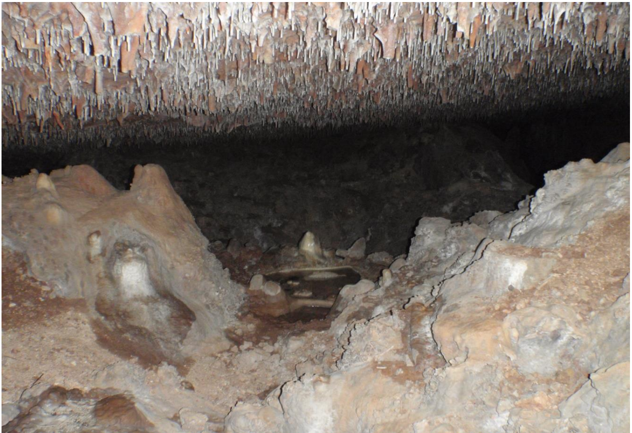
Plafond hérissé de petites concrétions et Gour, ~1,50m au niveau du gour.