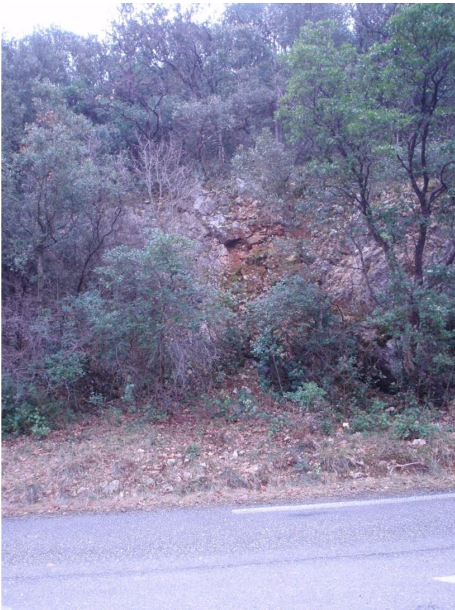
Entrée sous la « tâche » marron au centre de la photo.