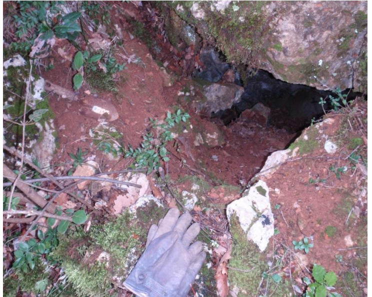
L'entrée avec l'outil de jardin à gauche en haut.

L'entrée est assez large pour que je me laisse glisser dedans(elle se prolonge sur la droite mais elle est entrecoupée de blocs). J'allume ma frontale, une salle large et surbaissée se montre à la lumière. Le plafond est totalement hérissé de courtes concrétions, pour la plupart cassées. Le sol est chaotique avec un fouillis de blocs, des stalagmites cassées et un joli petit gour au milieu de cet espace sans Co2. Je sens un bon courant d'air aspirant.