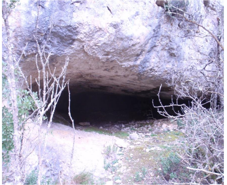
La Baume du Sabin