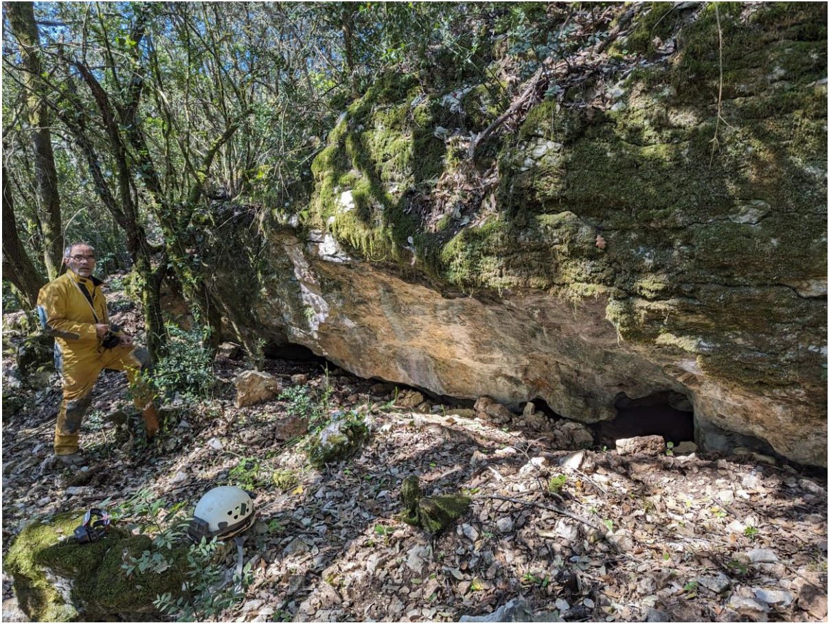
La large entrée de la Grotte du Grandé.

Il a son GPS qui fonctionne et, grâce à ses indications, nous trouvons l'entrée. Elle se trouve face au 2 ème mur en montant vers Méjanne le Clap (descendre dans la Combe et remonter de quelques mètres). Elle s'ouvre sous une petite barre rocheuse (2/3m) avec une largeur d'au moins 5 ou 6 m. Sa hauteur ne dépasse pas 50cm.