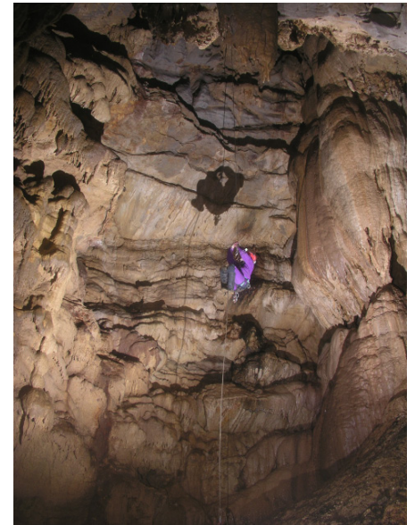
P17 du tragadero de los Perros (JYB, 16/09/2016)