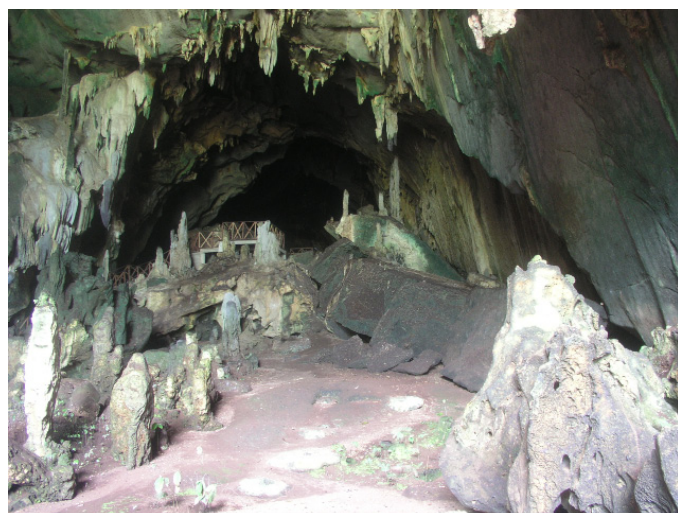
La cueva de las Lechuzas (JYB, 19/09/2016)