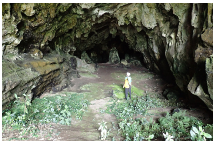
Cueva Moreno. (JLG, 11/11/2018)