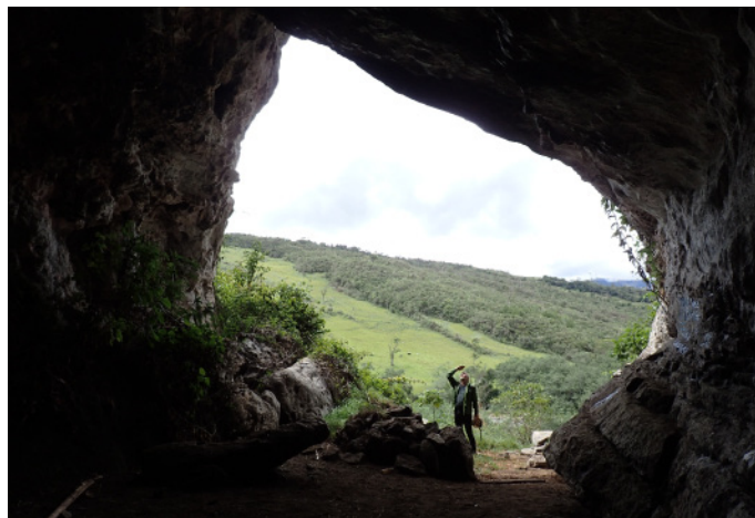
Cueva Moreno. (JLG, 11/11/2018)