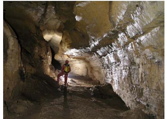
Cueva Grande de las Tres Naranjas. (JYB, 26/08/2018)